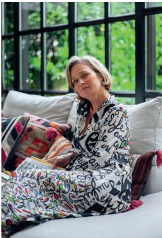
“Aan het lezen op mijn favoriete plek: de zetel.”