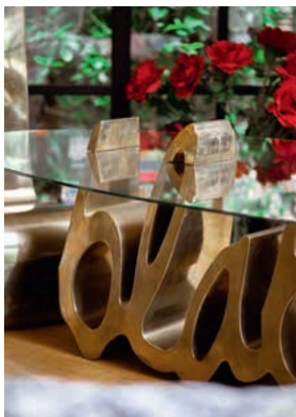
“De Blabla -salontafel die ik in 2008 maakte.”