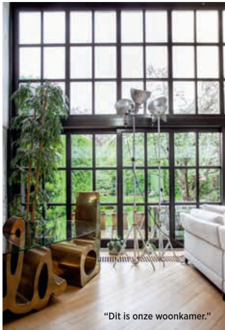
“Dit is onze woonkamer.”

eigenlijk hadden we geen plek om even gezellig samen tv te kijken. Net voor de lockdown - noem het een ingeving - bestelden we zo'n royale zetel, met een gedeelte om te liggen, echt supercomfortabel. Die arriveerde dus op de dag van de lockdown: de hele covid-periode hebben wij in die zetel gehangen. Héérlijk.” “Ik denk dat ik in geen enkel cliché pas: ik heb ook niks met tuinen. Ik word al ongemakkelijk als ik een worm zie, dus nee, ik heb het afgelopen jaar geen groene vingers ontwikkeld. Geef mij geen plant, want die gaat diezelfde dag nog dood. Weet je, zelfs in de tuin heb ik valse planten staan. Ze staan er intussen al zó lang, dat ze een beetje blauwig-groen zijn verkleurd, best griezelig eigenlijk. Als er tegenwoordig mensen bij ons in de tuin komen, vragen ze verrukt vanwaar die exotisch blauwe planten toch komen. Haha, dat is dus mijn tuin. Van parken houd ik dan weer wel; een erfenis van toen ik nog in Londen woonde. Ik vind het heerlijk om er te joggen, te wandelen of gewoon op een bankje te zitten. Mijn huis zit ‘gevangen’ tussen twee parken; ik vond het daarom meteen perfect. Het was vreselijk dat tijdens de lockdown de parken gesloten waren. Zelfs op de bankjes was lint gespannen, zodat je niet kon gaan zitten - een triest zicht.”