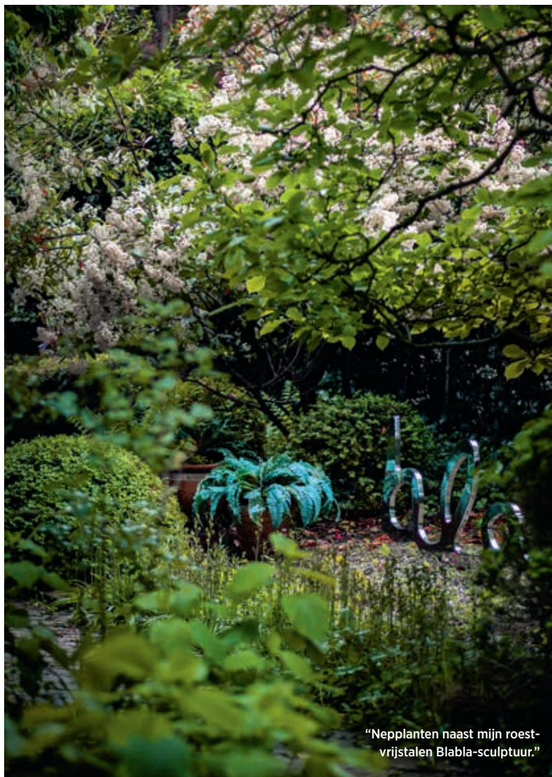
“Nepplanten naast mijn roest-vrijstalen Blabla -sculptuur.”

“Vroeger dacht ik dat ‘thuis’ is waar je roots liggen. Vandaag weet ik: thuis is waar je je thuis maakt, waar je familie is, waar je werk is, waar je hart ligt. Dat is hier, in Brussel . Het huis tussen de twee parken, met mijn studio, mijn Blabla -tafel, mijn gezin. Over die hele strijd voor erkenning kan ik niet te veel vertellen, maar weet: mijn naam is dan wel veranderd, ik ben nog precies dezelfde. Ik hoop alleen dat ik met die titel iets goeds kan doen, meer niet.” ●