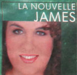
LA NOUVELLE JAMES