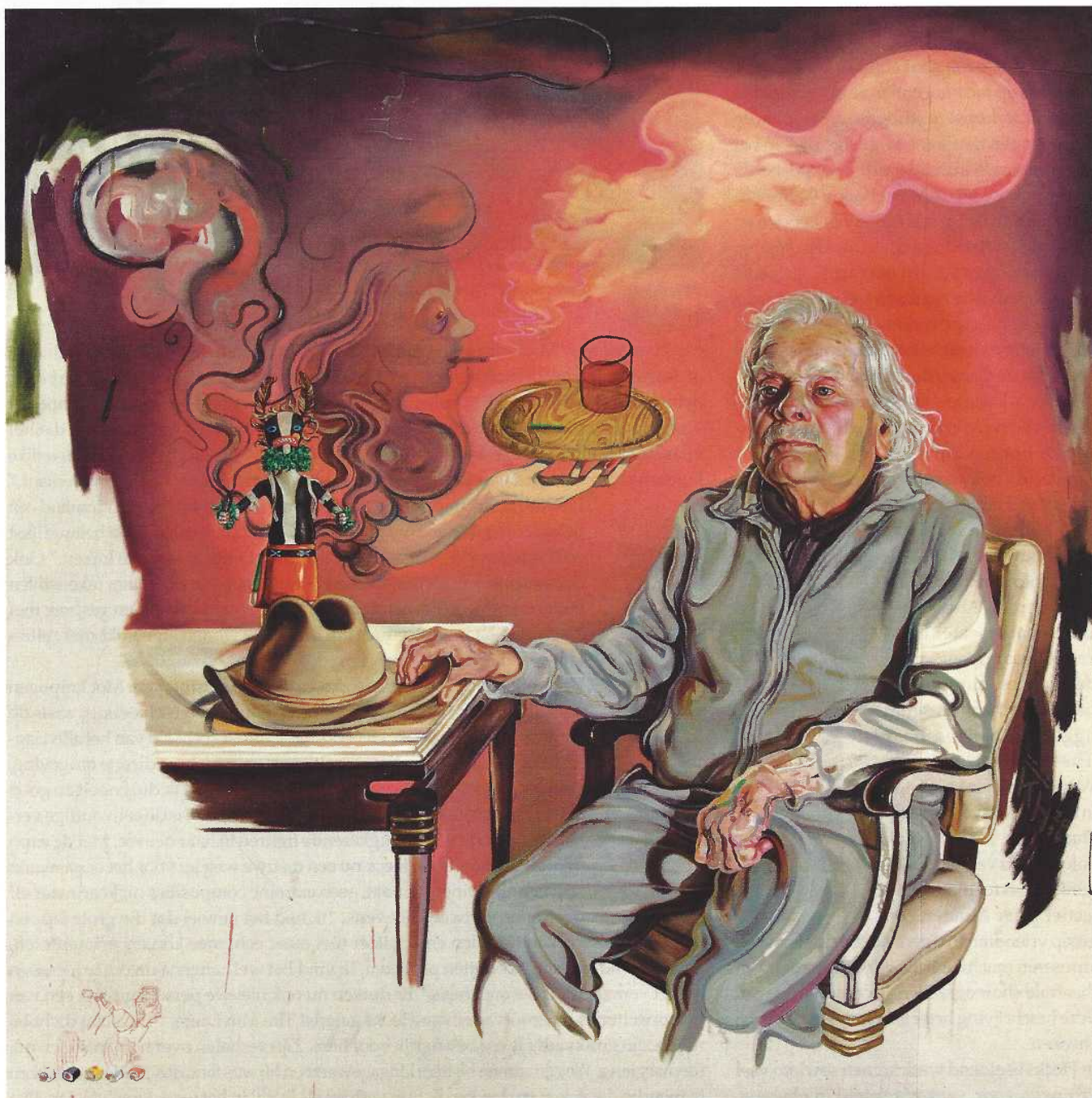
'O Leon', 2014, Kati Heck