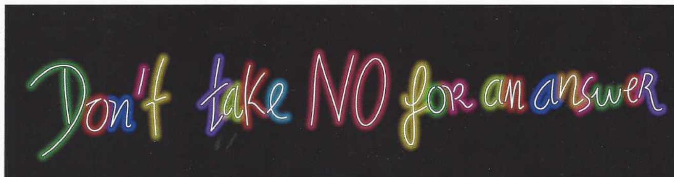
'Don't take NO', 2014, Delphine Boel